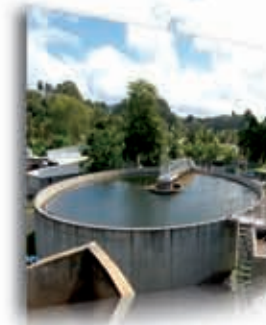
Station d'épuration du Gosier