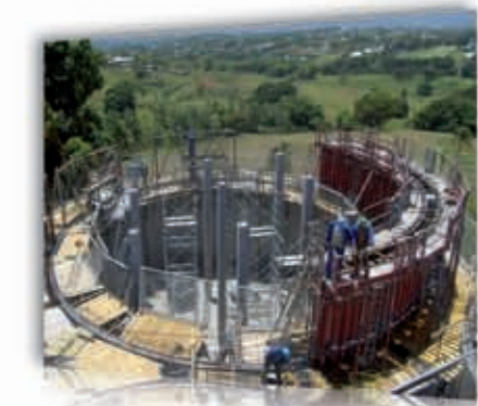
Construction de la station d'épuration de Fond Budan à Baie-Mahault