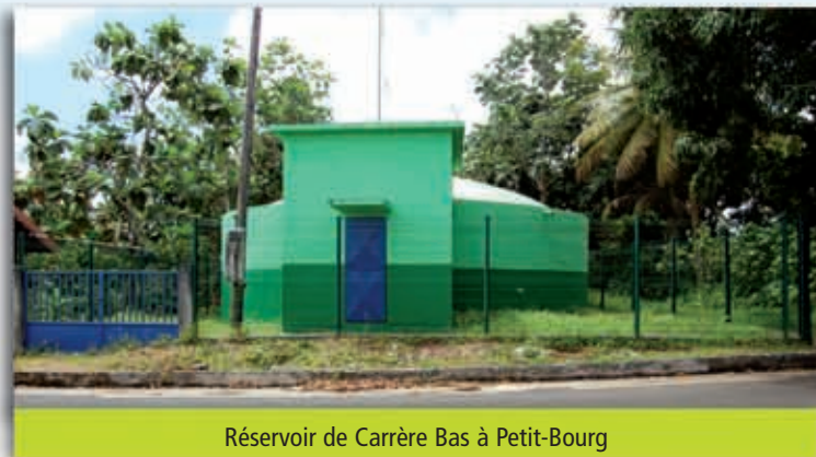
Réservoir de Carrère Bas à Petit-Bourg

Sous la co-présidence du CNE, de l'ONEMA et de la FNCCR