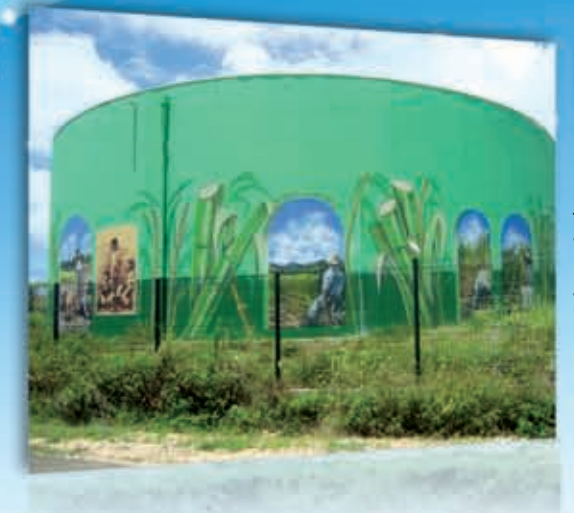
Réservoir de Champ Grillé au Moule