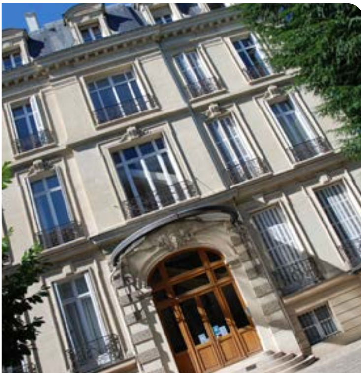
Siège de la FNCCR à Paris

Nous intervenons à votre demande pour des actions personnalisées et sur site, au plus près de votre projet.